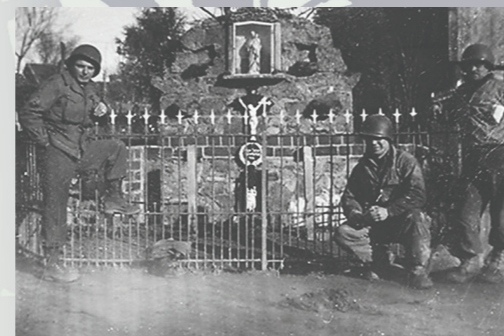
Voor het Mariabeeld in Melleschet, september 1944