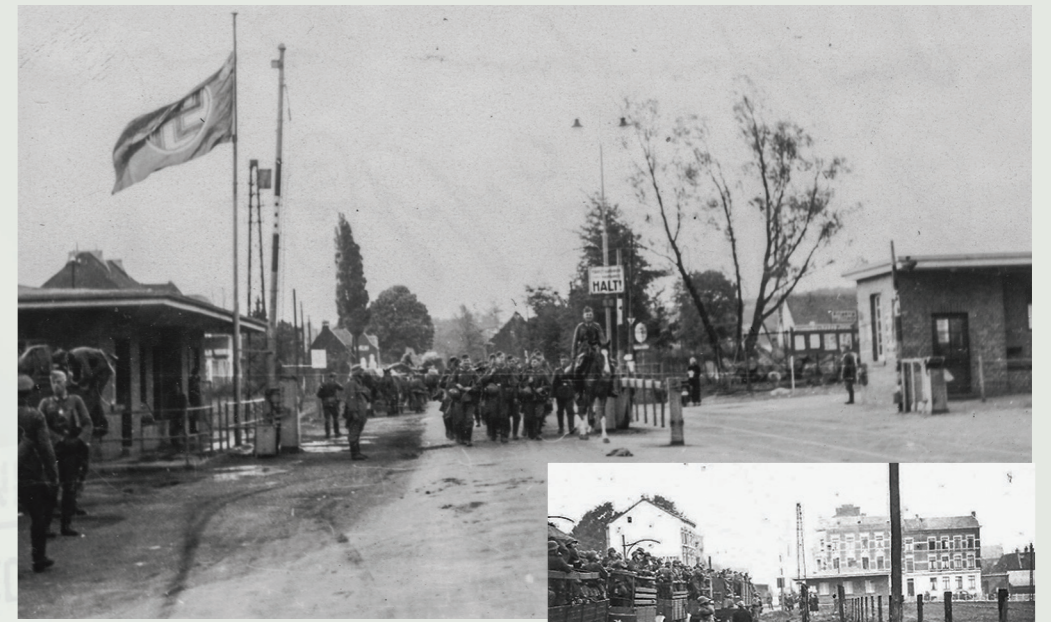
Nederlands-Duitse grens Vaals

De 4de tankdivisie van het 36ste Panzer-Regiment viel via Mamelis ons land binnen. Door de wegversperring ter hoogte van klooster Mamelis trokken de tanks richting Gulpen en Maastricht. Tegen deze overmacht konden de bunkers bij Mamelis en Nyswiller geen verweer bieden.