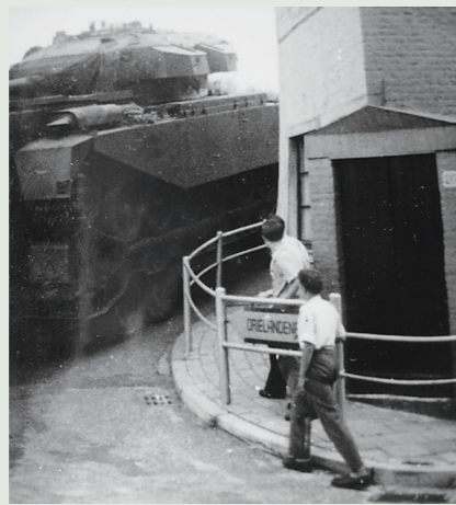
houd kregen de Duitsers de kans zich te reorganiseren. Hierdoor werd er dus meer tegenstand geboden dan gepland.