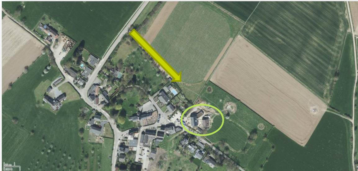
Afbeelding 2. Toegangsweg naar de parkeerlocatie wijndomein (groene pijl) en locatie Wijndomein (cirkel)

De parkeervoorziening met de 16 parkeerplaatsen wordt alleen bij bijzondere evenementen gebruikt en is alleen via een wijngaard en een halfverharde (grind)weg te bereiken. Hiertoe dient het hek nabij de bebouwde kom van Holset te worden geopend. Ook de 6 parkeerplaatsen naast de woning zijn tijdens bedrijfsvoering normaliter afgesloten (door middel van een touw over de inrit).