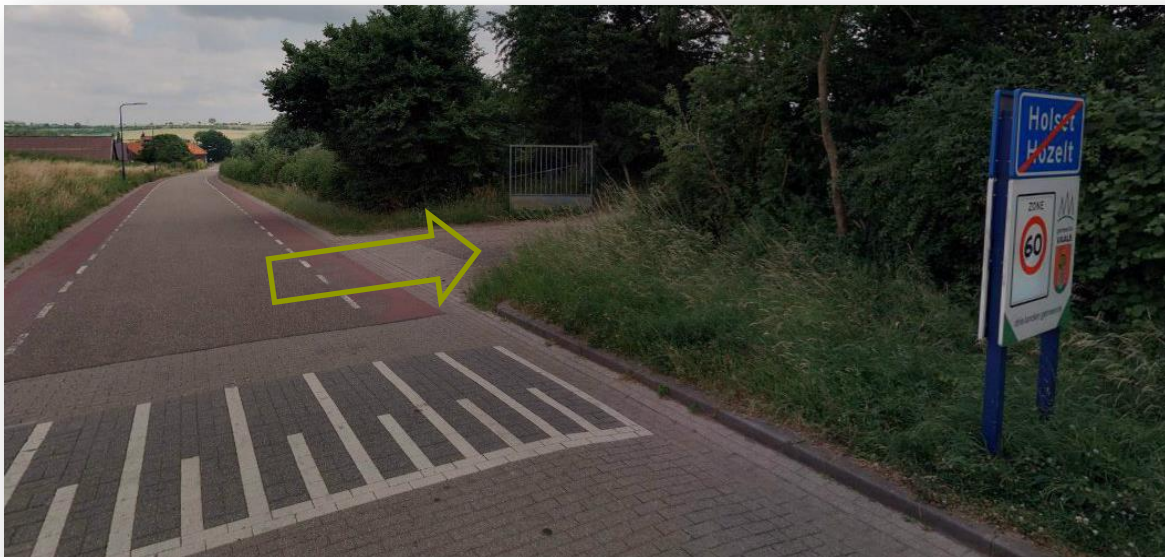
Afbeelding 3. Entree naar het wijndomein nabij de komgrens Holset (aan de weg Holset)